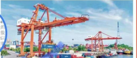
武汉港一季度集装箱吞吐量同比增长34.89%。

长江日报讯 记者汪文汉报道,武汉港一季度集装箱吞吐量创历史新高,同比增长34.89%。据海关统计,一季度,武汉港集装箱吞吐量达39.3万标准箱,同比增长34.89%。其中,1-3月,武汉港集装箱吞吐量分别为13.1万、13.2万、13.0万标准箱,分别同比增长34.89%、34.89%、34.89%。 一季度,武汉港集装箱吞吐量创历史新高,同比增长34.89%。据海关统计,一季度,武汉港集装箱吞吐量达39.3万标准箱,同比增长34.89%。其中,1-3月,武汉港集装箱吞吐量分别为13.1万、13.2万、13.0万标准箱,分别同比增长34.89%、34.89%、34.89%。